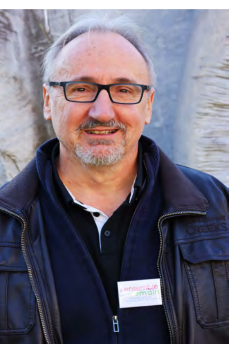
21- Éric Ayrault - 61 ans